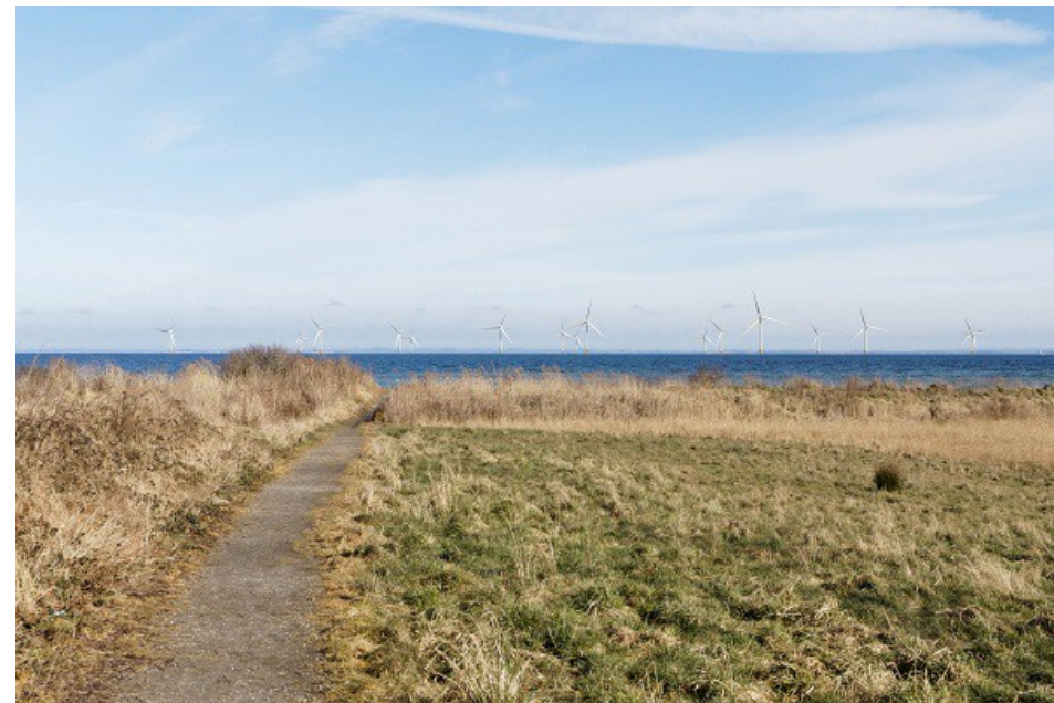
Visualisering ved Vinkelbæk, klart vejr, 8MW

Af Peter Rathje (mailto:peter.rathje@projectzero.dk)