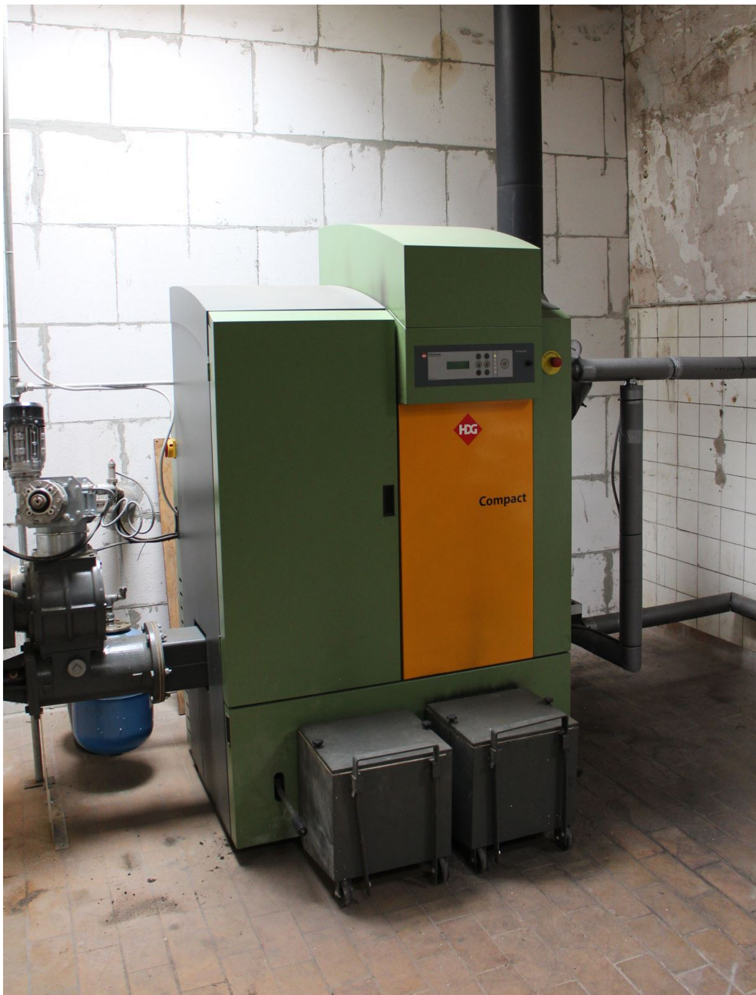
Tre oliefyr måtte lade livet til fordel for dette større pillefyr, der nu varmer alle fire lejligheder igennem