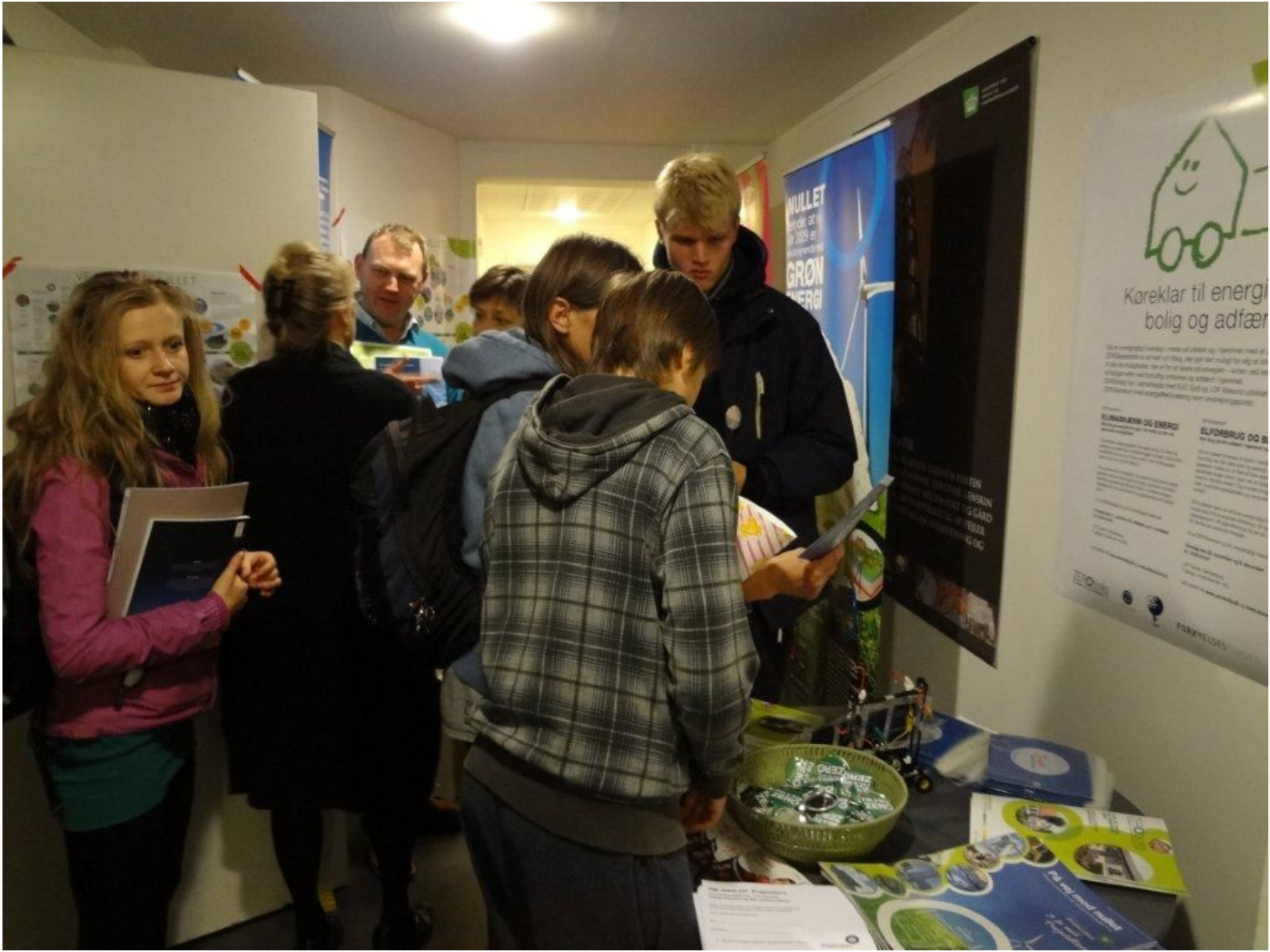
Børn, studerende og voksne flokkedes om ProjectZeros stand og materialer