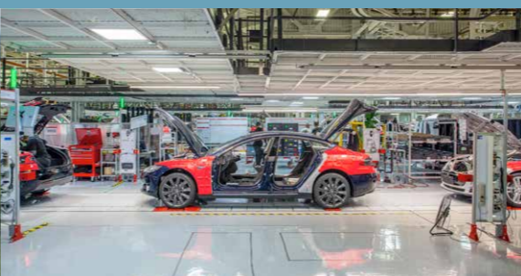
Teslas fabrik i Fremont

Tesla Motors er en amerikansk produktionsvirksomhed, der er opkaldt efter Nikola Tesla. Virksomheden er kendt for at producere elbiler i luksusklassen. De begyndte produktionen i 2003 og lancerede i 2008 Tesla Roadster, der som den først rigtige sportsbil på markedet skabte international opmærksomhed. I dag producerer Tesla ca. 80.000 biler om året med en typisk rækkevidde på 500 km. I første kvartal af 2014 var Tesla den mest solgte bil i Norge.