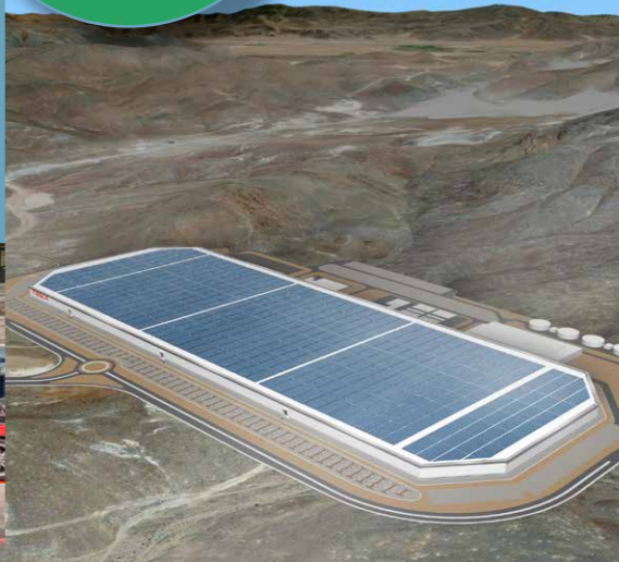
Teslas kommende Gigafactory i Nevada