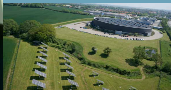
Linak i Guderup set fra oven

ProjectZero er visionen om at skabe økonomisk vækst og nye jobs i Sønderborg-området baseret på omstillingen til et CO 2 -neutralt samfund, så Sønderborg kan blive et CO 2 -neutralt vækstområde i 2029 – 20 år før resten af Danmark. ProjectZero vandt i 2010 EU's Sustainable Energy Award for Sustainable Energy Communities og inspirerer til bæredygtig byudvikling i bl.a. Kina, Tyskland og Polen. Flere af byerne er godt i gang med lignende initiativer, assisteret af rådgivning og løsninger fra Sønderborg-områdets virksomheder.