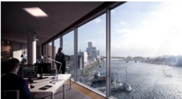
Udsigten fra det nye kontor B er fantastisk.

Knapt er det store videnshus klar til indflytning på Sønderborgs Havnefront, før entreprenør-firmaet A. Enggaard nu udbyder lejemål i en ny nabobygning, som bliver opført, når der er lejere til byggeri