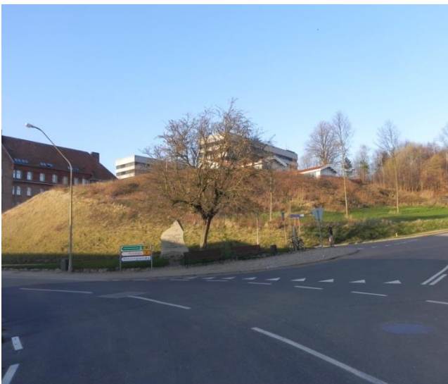
På dette hjørne er planen at bygge parkeringshus

Projektet består af mange delelementer. Blandt dem er promenaden, den lille marina, parkering og opholdsarealer, Hønekilden som er pladsen neden for trappen til kirken, og godsbanestien som er det gamle godsbaneterræn.