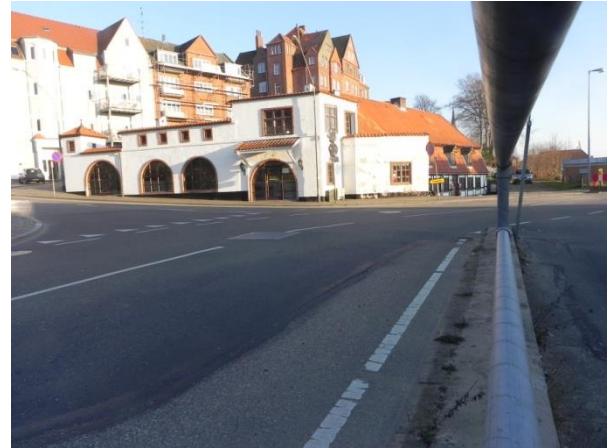
Grillbaren er tænkt ind i kollegiebyggeriet

Formålet med projektet er at skabe en helhed og sammenhæng - også til de planlagte byggerier og til det kollegiebyggeri, som den fælles bestyrelse for kollegierne i Sønderborg gerne vil bygge på havnen. Endnu er det ikke besluttet, hvor kollegierne skal placeres. Og det skyldes, at kommunen forsøger at få en aftale med forsvarsministeriet om at overtage en del af kasernegrunden, som vil være velegnet til både kollegiebyggeri og parkering. Også grillbaren på hjørnet af Helgolandsgade og Nørre Havnegade er tænkt ind i en sådan løsning med et byggeri i fire etager.