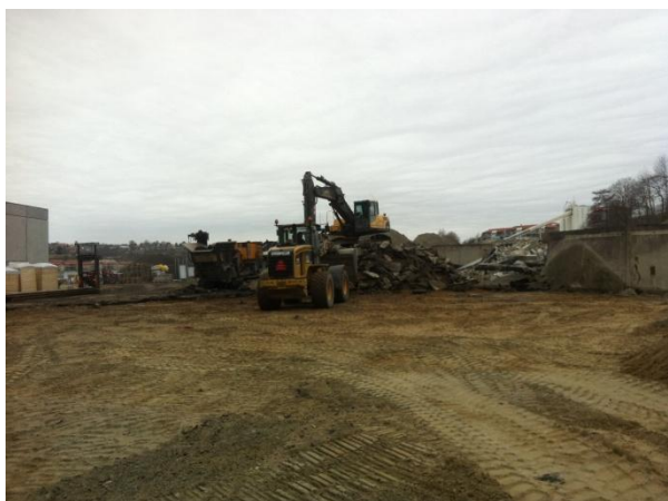
Havneselskabet fjerner asfalten, som var blevet liggende som stabilt underlag for byggekranen

Lejemålet på 5. sal, måler ca. 130 m 2 , da 5. sal er lidt mindre end de resterende etager. Lejemålet deles med KPMG og har direkte adgang til den 184 m 2 store tagterrace.