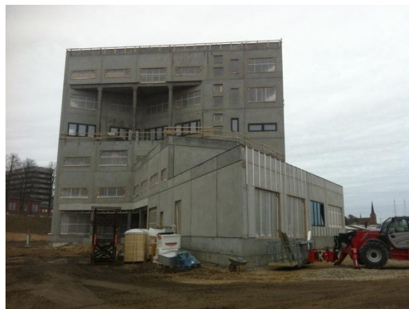
Videnshuset – før det bliver monteret med bronzerede aluminium facadebeklædning

Vindues- og facadefolkene arbejder med én etage af gangen – oppe fra og ned, hvilket er månenen at gøre det på, og så snart en etage er lukket med vinduer, er huset tæt, så tømrerne og malerne kan gå i gang inde i bygningen. Begge disse entrepriser bliver der entreret med i løbet af få uger.