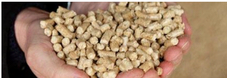
Træpillerne som bruges til opvarmning

Vælg den case du vil læse mere om i menuen til venstre